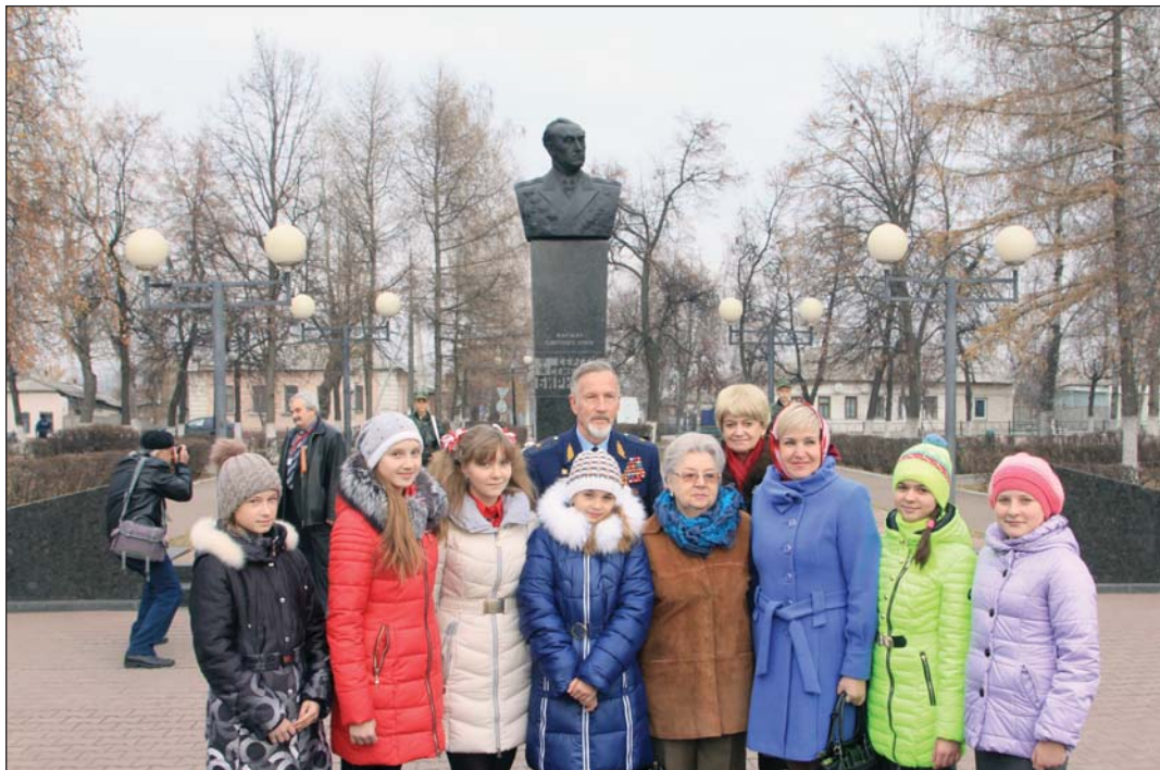
Участники конференции с учащимися школ г. Скопина у памятника Маршалу С.С. Бирюзову