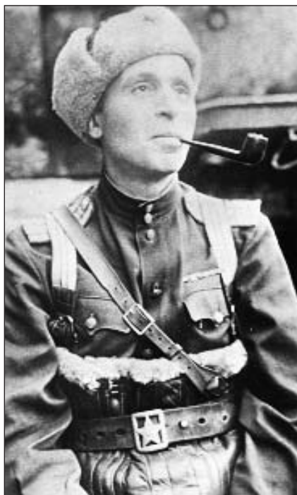
А.И.Соммер (1897–1966 гг.) Герой Советского Союза, полковник, легендарный комбриг

Работа посвящена моему прадеду, участнику Первой мировой войны, Герою Советского Союза, командиру 89-й танковой бригады 1-го танкового корпуса 3-го Белорусского фронта, генерал-майору танковых войск Андрею Иосифовичу Соммеру.