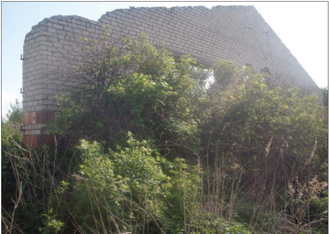
Руины фермы близ деревни Конаковка

империи: перед Первой мировой войной со времён переписи 1897 г. увеличилось на 33,4%. Естественный прирост населения России в 1901–1913 гг. на 1 тыс. жителей равнялся 17,2 14 .