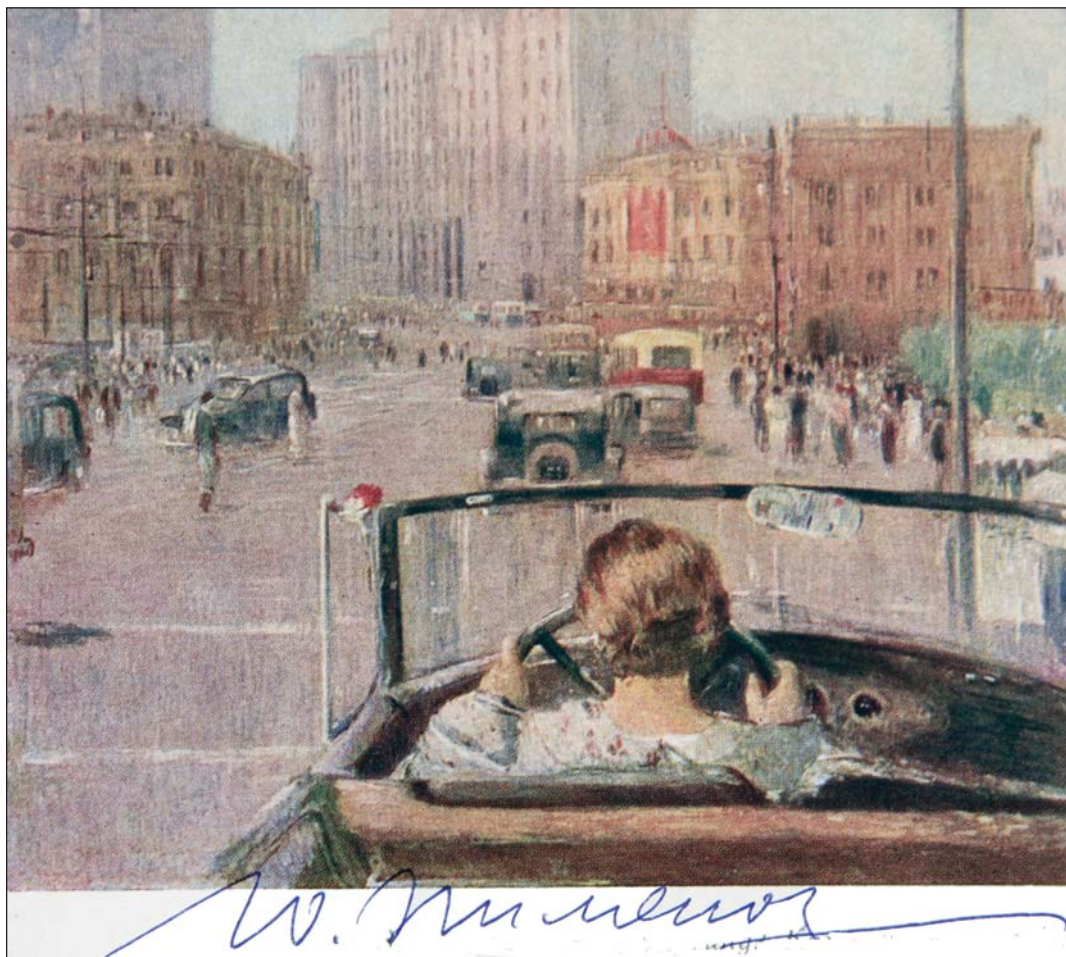
Новая Москва. Худож. Юрий Пименов. 1937

московского метро — гордость новой власти). И лишь дальше видим нелепую громаду Госплана, возведённую на месте великолепных древних палат В.В. Голицына. «Вовремя» была снесена церковь Параскевы Пятницы, ликвидированы палатки торговцев — символы старой Москвы. Слева — очертание здания, напоминающего Дворец Советов на месте снесённого к тому времени храма Христа Спасителя. Но это, скорее, фантазия художника с попыткой уравновесить картину — ведь