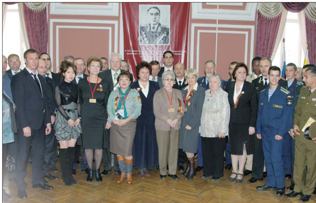
Участники конференции в РГУ имени С.А. Есенина