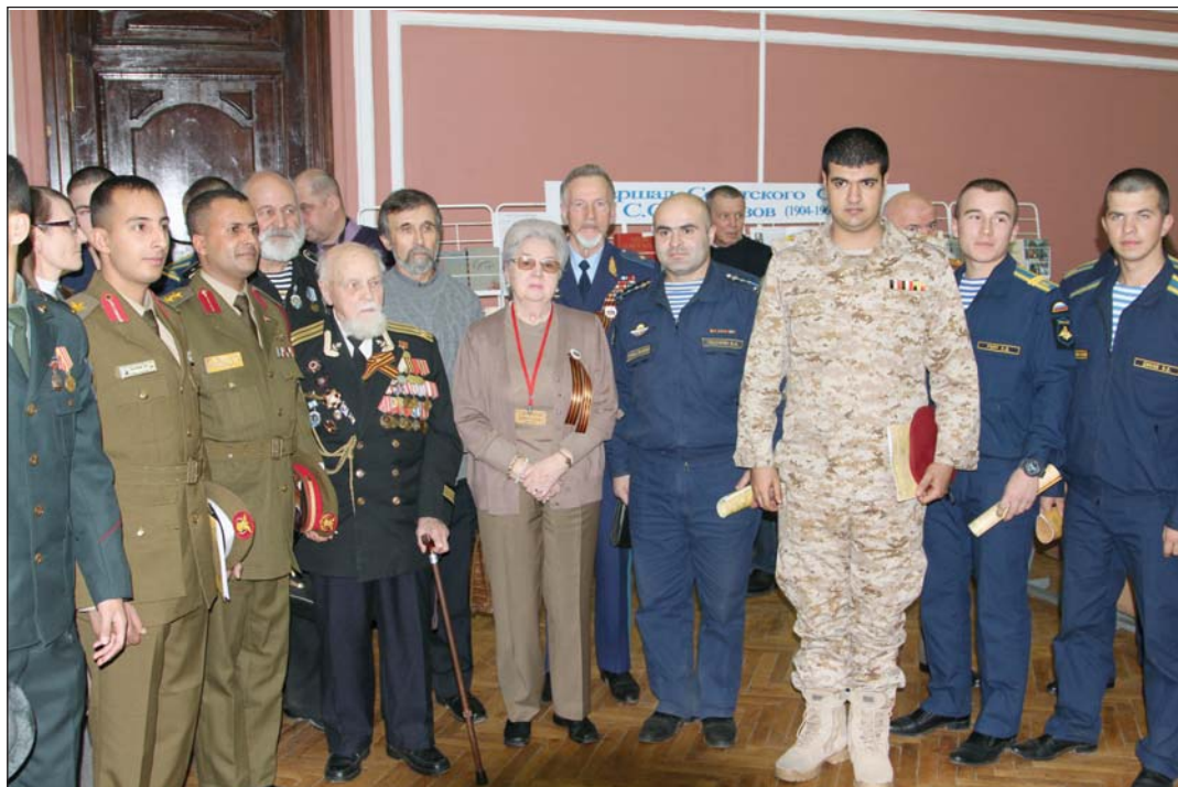
Фото на память с участниками конференции в РГУ имени С.А. Есенина

подтвердила важную роль военно-теоретического наследия выдающихся полководцев Великой Отечественной войны. Определяющее значение имели разработанные ими стратегические планы разгрома военной машины фашистской Германии, создания оборонно-промышленного комплекса нашей страны в послевоенный период.