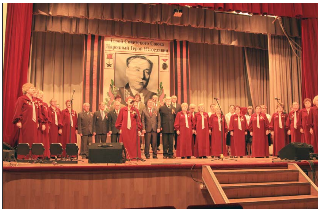
Концерт в честь участников конференции в г. Скопин