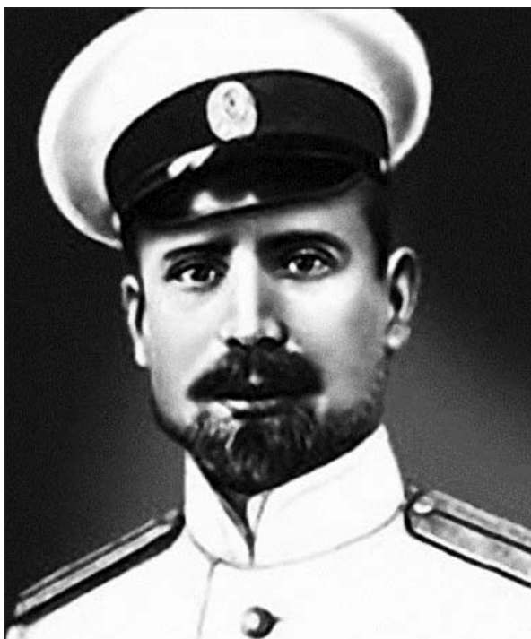
Григорий Яковлевич Седов

Григорий Яковлевич Седов родился в семье неграмотного азовского рыбака. Страсть к морю, познанию его тайн помогла ему, несмотря на огромные трудности, получить звание штурмана дальнего плавания... В 1910 г. у него родилась идея организации экспедиции к Северному полюсу. Но она не нашла поддержки официальных властей царской России. Снарядив на частные пожертвования судно «Святой Фока», в 1912 г. с горсткой смельчаков Георгий Седов отправился к полюсу. «Итак, сегодняшний день, мы выступаем к полюсу; это — событие и для нас, и для нашей родины». Из приказа Г. Седова от 2 (15) февраля 1914 г.