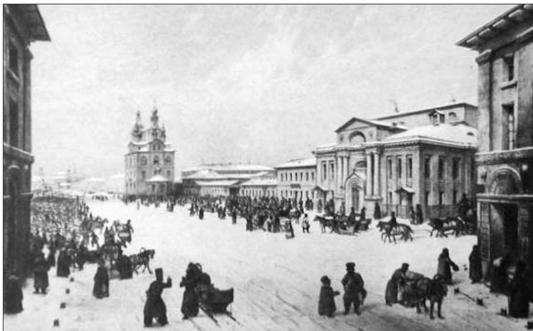
Охотный Ряд. Старый вид

стской манеры, за которую ему досталось немало как слав, так и критики. Её он не пожелал или не смог полностью преодолеть. Может, поэтому его произведения полны свежести и очарования.