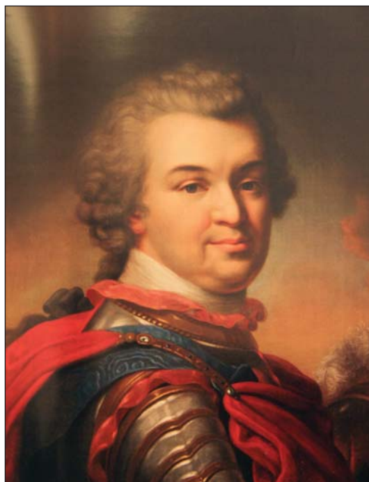
Светлейший князь Г.А. Потёмкин-Таврический. Неизвестный художник. Начало XIX века

Личность Григория Александровича Потёмкина давно волновала воображение учёных и писателей, историков и поэтов. Его судьба, столь плотно сплетённая с судьбой Екатерины II, его неповторимый характер, на первый взгляд сотканный из противоречий, а в основе своей удивительно цельный, его дела, столь грандиозные, что современники порой видели в них феерию — всё стало предметом толкований, слухов, сплетен, романтических историй, легенд. В литературе различных стран ему посвящены исследования, поэмы и романы. Но так и не создано ни одной научной биографии.