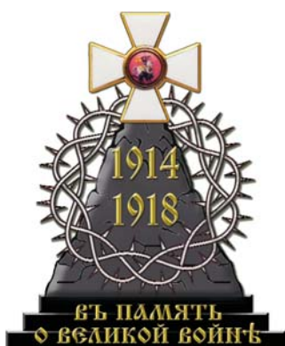
Автор логотипа Е.А. Комаровский