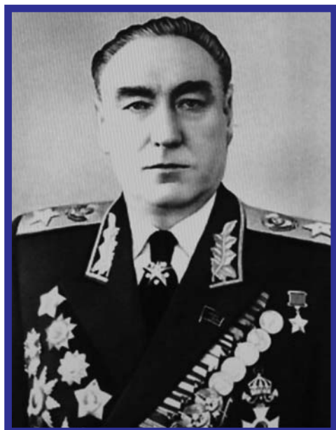
Маршал Советского Союза Сергей Семёнович Бирюзов