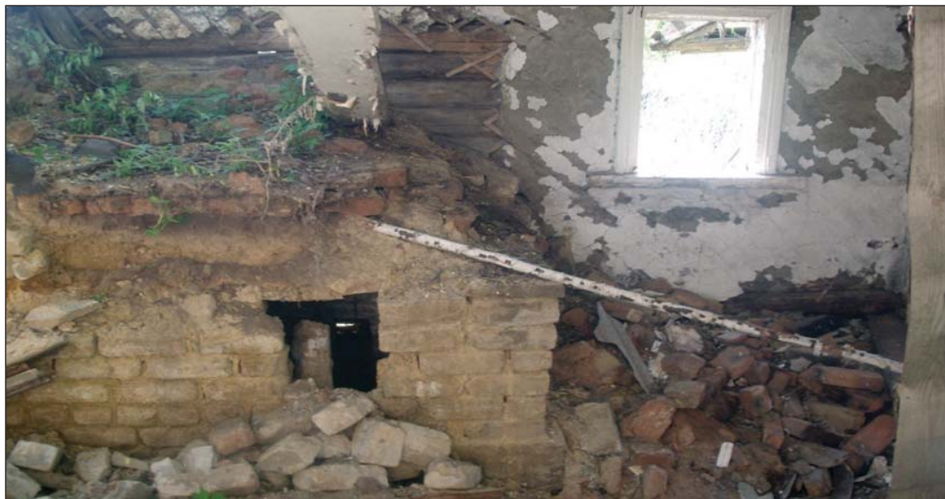
Развалины дома с русской печью деревни Приютовка

работала в читальном зале ГАРО, где изучала клировые ведомости по церквям селений Напольновской волости, планы селений 5 . Затем в Сараевском районе архиве изучала демографические данные ЦСУ начиная с 1942 года по 1947 г. Продолжила работу летом: совершила экскурсии по территории поселения, чтобы посмотреть, что осталось от некоторых из них, беседовала с людьми, которые раньше проживали в данной местности. Наконец, в сентябре 2013 года получила статистические данные по Напольновскому поселению в местной администрации.